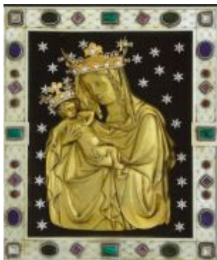
Paladium země České se svatováclavskými korunkami